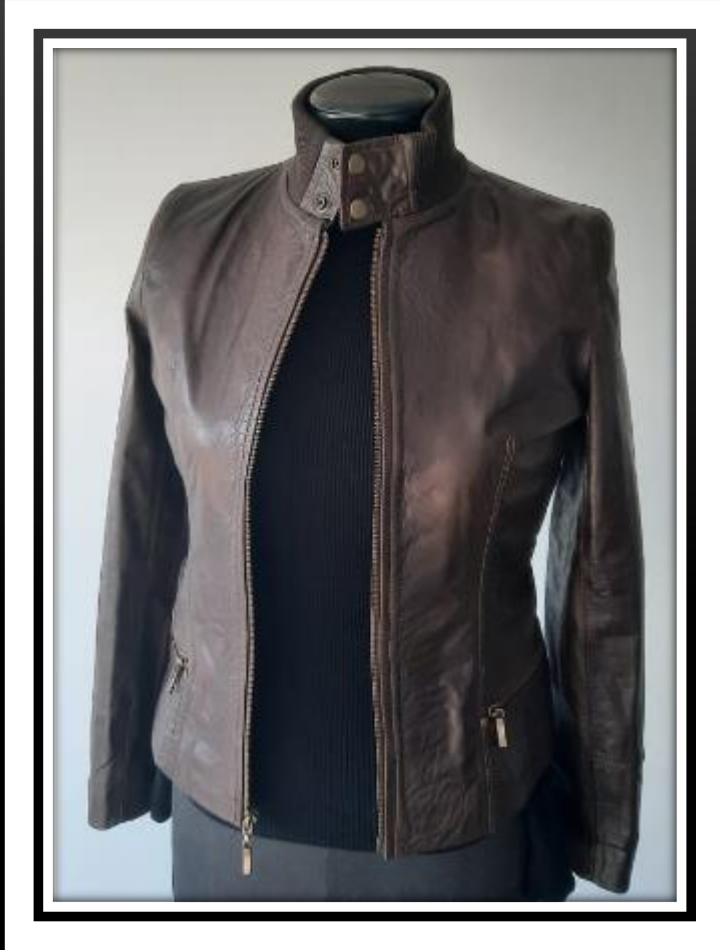
Descripción: Chaqueta en cuero traslucido Ref.: Ana Color: cafe Talla: 8 Precio: $410.000