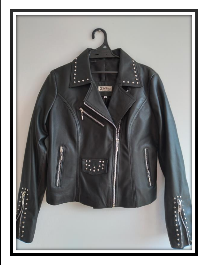
Descripción: Chaqueta en cuero cruzada Ref.: Chamarra Taches Color: negra Talla: M Precio: $460.000