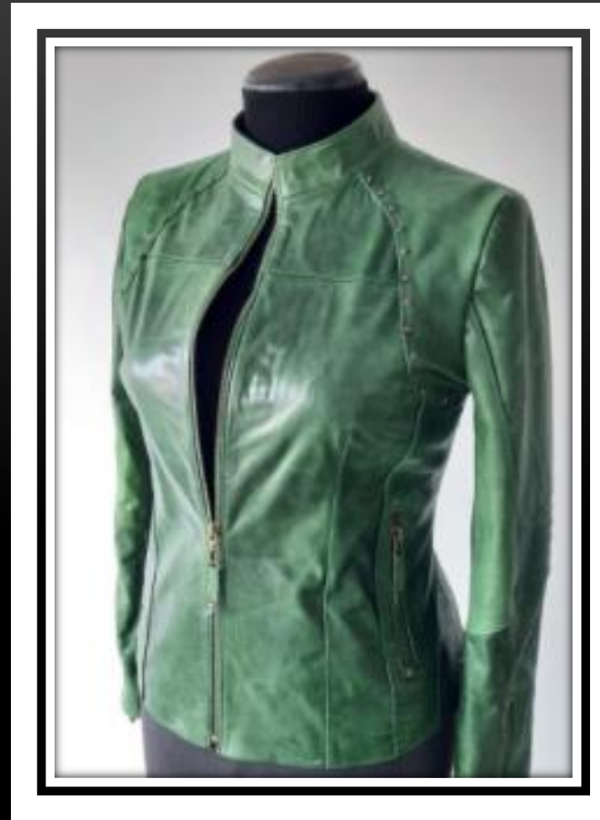
Descripción: Chaqueta en cuero traslucido Ref.: Karla Color: Verde Talla: 10 Precio: $390.000