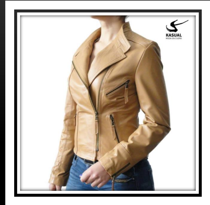
Descripción: Chaqueta en cuero Ref.: Cielo Color: Amarillo mostaza Talla: 10 Precio: $420.000